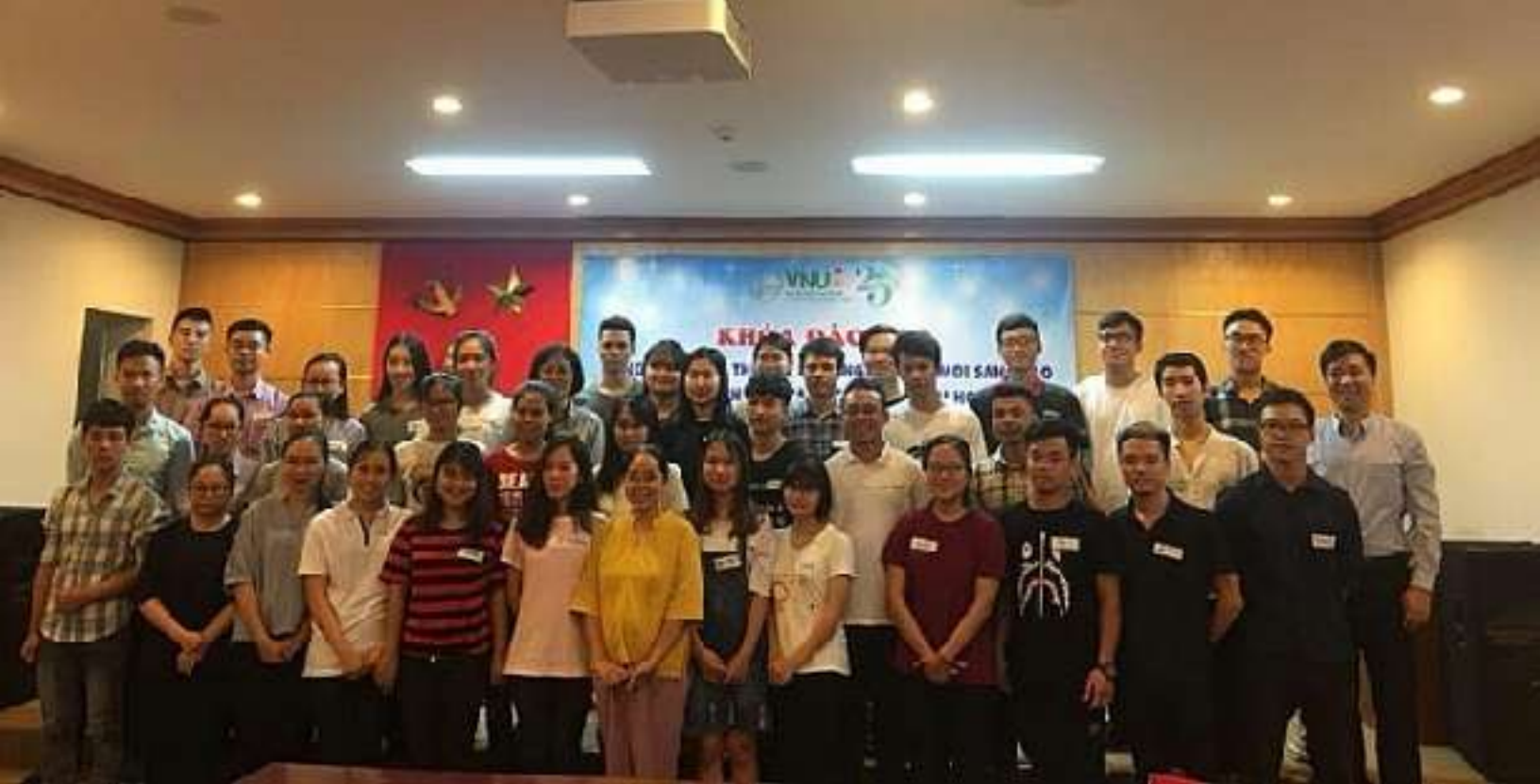
Khóa đào tạo Khởi nghiệp đổi mới sáng tạo cho sinh viên ĐH Quốc gia Hà Nội

vấn đề pháp lý - kế toán mà các doanh nghiệp sáng tạo thường xuyên gặp phải, cũng như tổng hợp nhu cầu sử dụng dịch vụ, tư vấn của doanh nghiệp KNST.